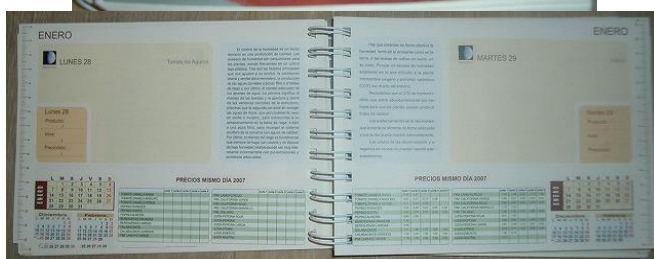
エルヒド市役所が配布している農作業日誌