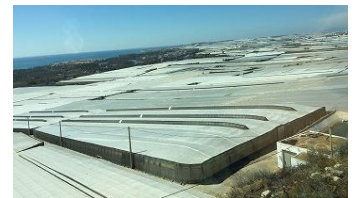
アルメリアのビニルハウス群