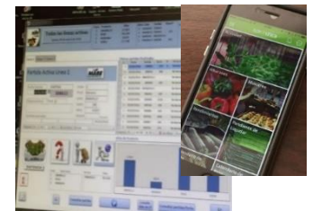
農協のERPシステムと生産者の端末