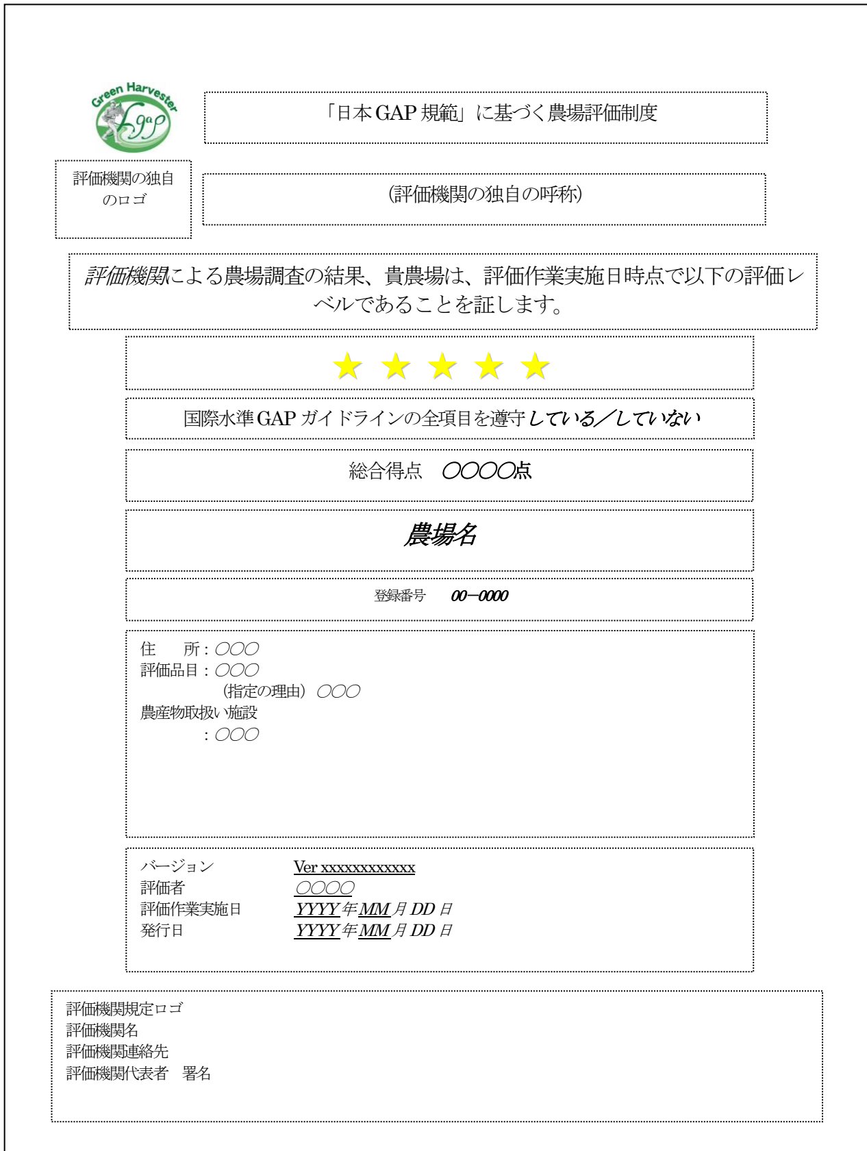
図 1-1 総合評価証書 標準様式(農場評価)