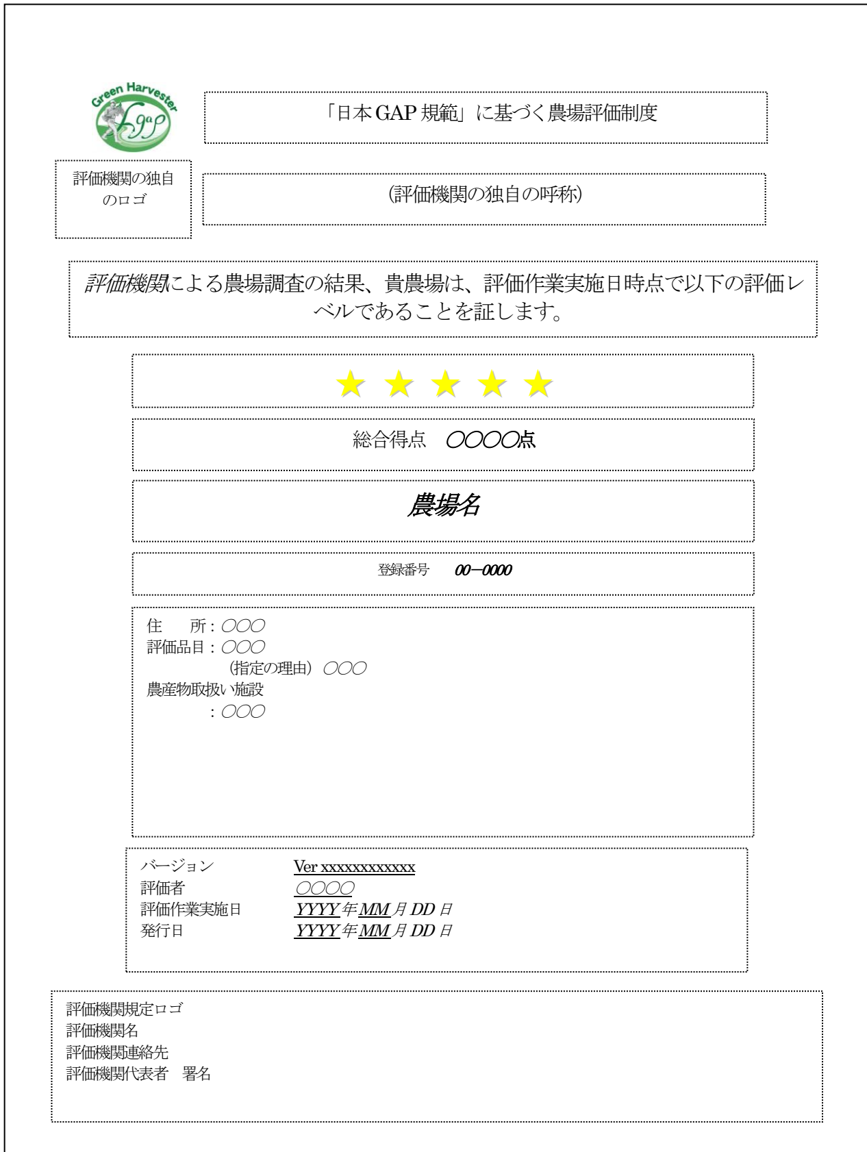
図1 総合評価証書 標準様式(農場評価)